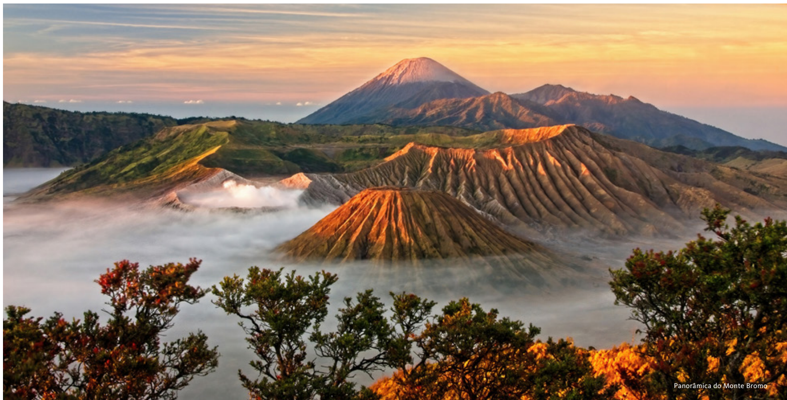
Panorâmica do Monte Bromo

ilha. Continuação para a célebre Praia Rosa, assim chamada pela tonalidade singular da sua areia, resultante da mistura de fragmentos de coral com areia branca. Tempo para banhos nas águas cristalinas, junto aos corais, e para fazer snorkeling, observando a fauna tão especial deste verdadeiro paraíso, onde abundam peixes exóticos. Visita à ilha de Komodo, habitat natural do lendário dragão-de-komodo. Acompanhados por guardas locais, percorremos trilhos na ilha, com a possibilidade de observar estes impressionantes répteis no seu meio natural, num contacto raro com uma das espécies mais fascinantes do planeta. Durante a tarde, fazemos paragem em Taka Makassar, um banco de areia rodeado por águas pouco profundas e translúcidas, ideal para um breve momento de contemplação e descanso. Prosseguimos até Manta Point, onde, com alguma sorte, poderemos observar raias-manta a deslizar elegantemente nas águas abertas. A última paragem será na ilha de Siaba, conhecida como “Baía das Tartarugas”, onde a presença frequente destes animais torna a experiência ainda mais especial. Regresso a Labuan Bajo ao final do dia. Almoço entre visitas. Jantar . Alojamento.