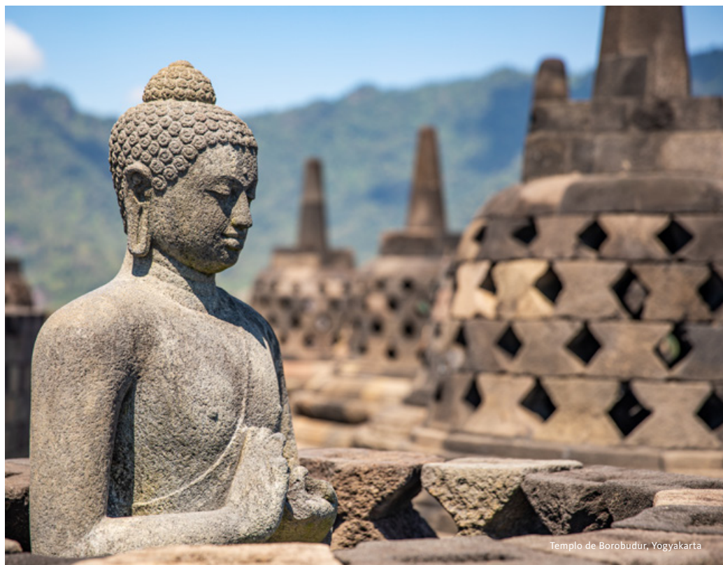
Templo de Borobudur, Yogyakarta

Saída em direção ao porto de Labuan Bajo para embarque em barco, iniciando a descoberta de alguns dos cenários mais emblemáticos da Indonésia. Paragem na ilha de Padar, onde um curto percurso a pé nos conduz a um dos miradouros mais impressionantes da região. Do alto, revelam-se três baías distintas, com tonalidades que variam entre o azul profundo e o verde-turquesa, criando um contraste único com as encostas áridas da