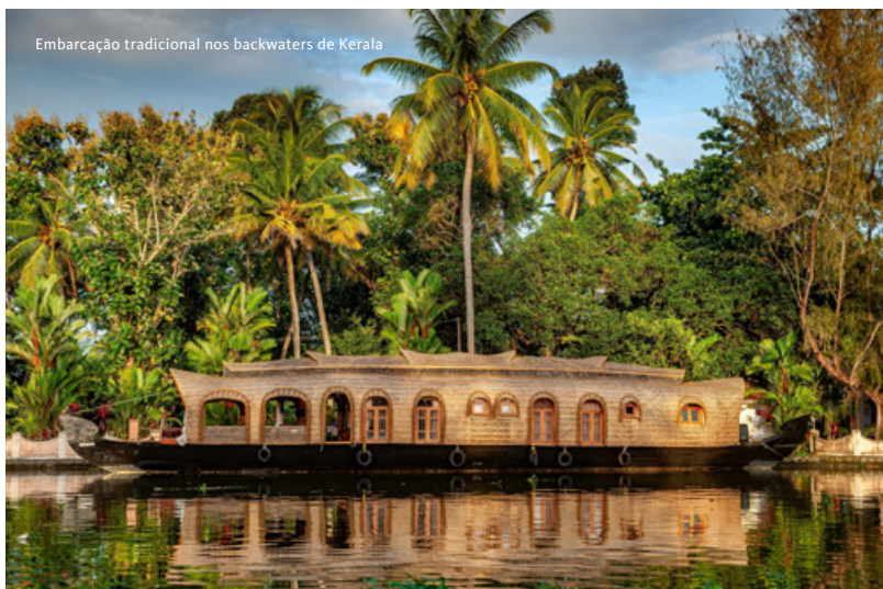
Embarcação tradicional nos backwaters de Kerala

Salvaguardam-se as situações cobertas ao abrigo da nossa apólice de seguro de viagem no capítulo Cancelamento Antecipado.