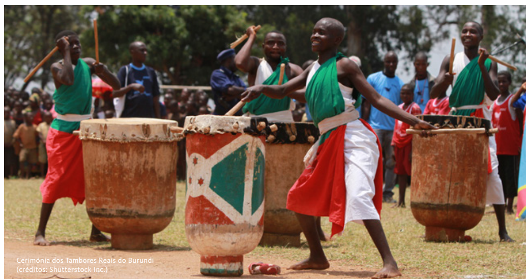
Cerimónia dos Tambores Reais do Burundi

Partida em direção à Floresta Impenetrável de Bwindi, no Uganda, atravessando a região do Parque Nacional dos Vulcões. Após o almoço , visita ao Ellen DeGeneres Campus do Dian Fossey Gorilla Fund, um centro dedicado à conservação dos gorilas-das-montanhas, onde é possível conhecer melhor o trabalho desenvolvido nesta área e o legado da primatóloga Dian Fossey, cuja investigação foi