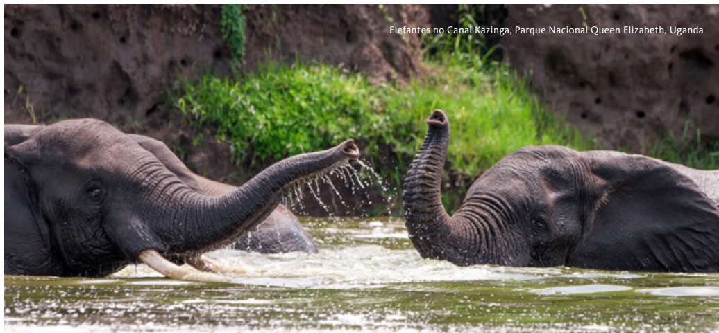
Elefantes no Canal Kazinga, Parque Nacional Queen Elizabeth, Uganda

fundamental para a proteção desta espécie. Continuação da viagem em direção à fronteira de Cyanika, onde efetuamos as formalidades de travessia para o Uganda. Prosseguimento até ao lodge situado nas proximidades da Floresta Impenetrável de Bwindi. Jantar e alojamento Chameleon Hill Forest Lodge ou similar.