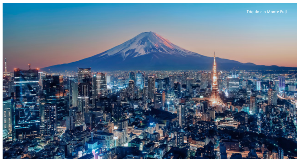
Tóquio e o Monte Fuji