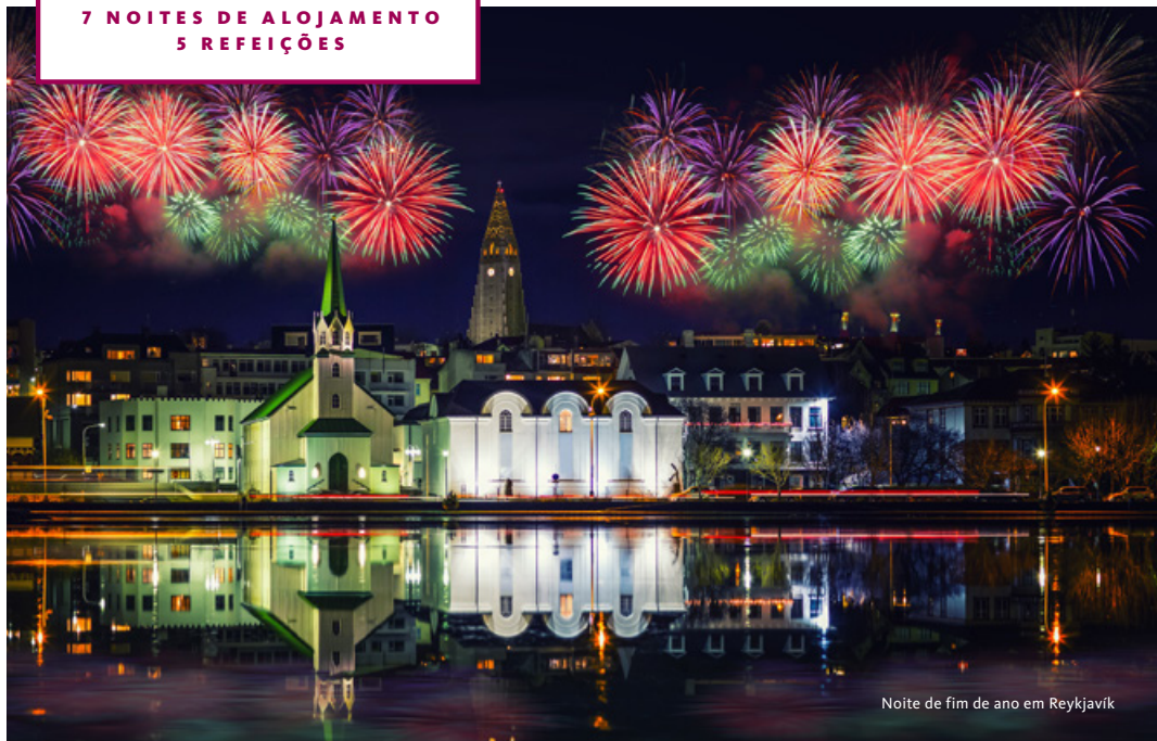
Noite de fim de ano em Reykjavik

Nos últimos anos, a Islândia tornou-se internacionalmente famosa pela intensidade da celebração da passagem do ano, cheia de luz e animação. Os islandeses tomam as ruas cobertas de neve e disparam fogos de artifício, durante horas a fio, e depois festejam noite dentro com trajes brilhantes e botas de neve. Acrescente a isto as maravilhas da natureza e as paisagens deslumbrantes que caracterizam este destino, bem como a permanente iminência de avistar uma Aurora Boreal, e estará, sem dúvida, perante uma viagem única e inesquecível. Feliz 2027!