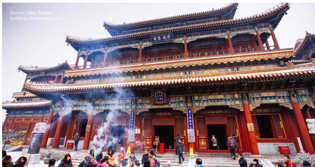
Templo Lama, Pequim