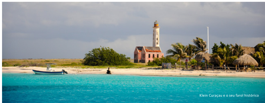
Klein Curaçau e o seu farol histórico

Saída, a pé, em direção ao Museu Marítimo de Curaçau, situado em Willemstad, capital da ilha. A visita permite explorar a linha do tempo de Curaçau desde as primeiras expedições espanholas (1492–1630) até aos períodos de domínio holandês e inglês (a partir de 1630). A exposição aborda as rotas marítimas do Caribe, o tráfico transatlântico de escravos e a importância estratégica do porto de Willemstad na dinâmica de poder regional. Visita ao bairro de Punda, o mais antigo de Willemstad, onde conheceremos o Forte Amsterdão e a Fortkerk. Almoço. Visita ao Museu Kura Hulanda,