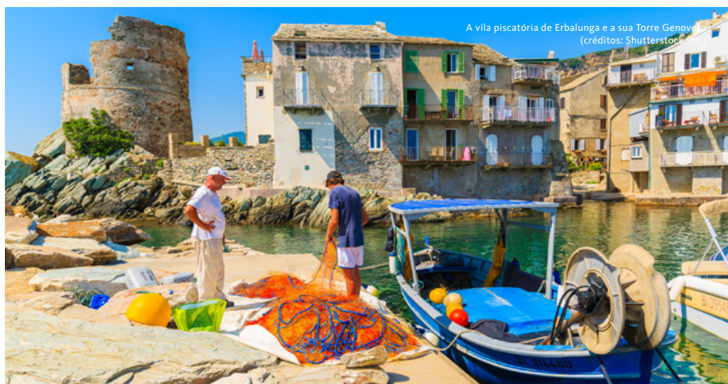
A vila piscatória de Erbalunga e a sua Torre Genovesa