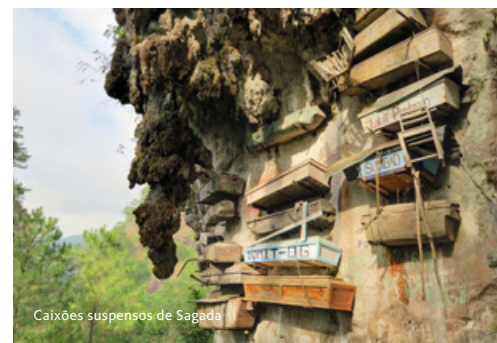
Caixões suspensos de Sagada