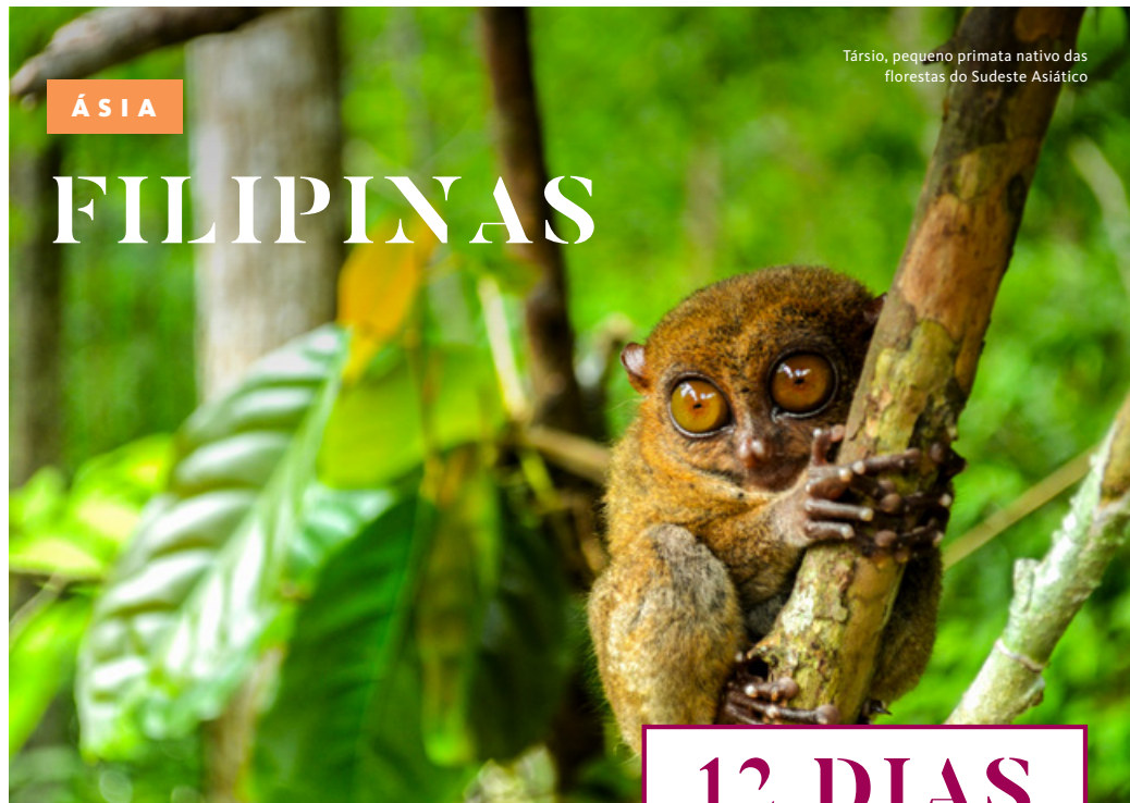
Társio, pequeno primata nativo das florestas do Sudeste Asiático