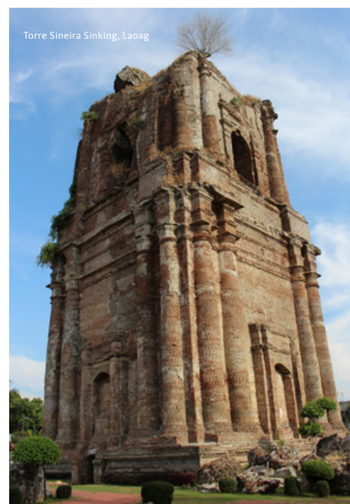
Torre Sineira Sinking, Laoag