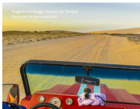
Viagem em buggy através do Parque Nacional de Jericoacoara

Saída em veículo 4x4, com ar condicionado, em direção à vila de Jericoacoara, passando pelas dunas de Luís Correia e percorrendo 75 km de estrada asfaltada até chegarmos à localidade de Chaval. Subida ao miradouro para observar esta pequena cidade, com as suas casas construídas no meio de pedras gigantes. Seguiremos para mais 50 km de estrada de asfalto até à cidade de Camocim, onde atravessaremos, em ferryboat, o Rio Coreã. Continuação da viagem ao longo de 40 km pelo litoral, através de trilhos, dunas de areia, altas palmeiras e coqueiros até Tatajuba, famosa pela Lagoa Grande. Paragem para almoço. Continuação para Jericoacoara. A duração de cada visita será influenciada pelos horários da maré e será decidida localmente em função das condições ao momento. Alojamento na Pousada Blue Residence 4* ou similar.