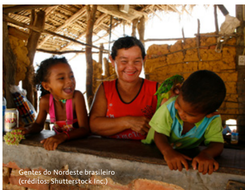
Gentes do Nordeste brasileiro

Em horário a combinar, transfer ao aeroporto para embarque em voo com destino a São Luís, a capital do estado do Maranhão. Chegada e início das visitas, com destaque para o centro histórico desta cidade fundada pelos franceses, em 1612, e reconhecida como Patrimônio da Humanidade pela UNESCO em 1997. As ruas em paralelos, casarões coloniais portugueses, igrejas antigas e azulejos coloridos são um charme. Passaremos pela Catedral de São Luís, pela icônica Rua do Giz, pelo Palácio dos Leões, a sede do governo do estado e pelo Mercado das Tulhas, especializado em produtos maranhenses. Continuação para a parte nova da cidade, onde se encontra a maior parte da infraestrutura urbana, prédios altos, avenidas largas, praias mais procuradas, centros comerciais e áreas empresariais. Jantar. Alojamento no Hotel Blue São Luis 4* ou similar.