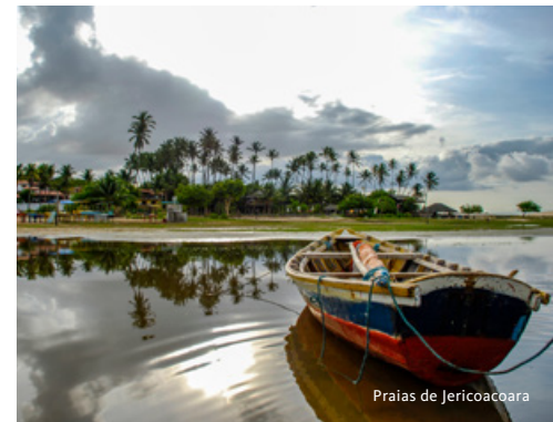
Praias de Jericoacoara

Saída em buggies, com motorista, para visitar o Parque Nacional de Jericoacoara, com as suas famosas e belíssimas praias. Seguiremos por trilhos na areia e subiremos pelas dunas até à lagoa do Paraíso. Possibilidade de visita ao famoso balneário Alchemist Beach (opcional). Continuação para a lagoa Azul e para o famoso Buraco Azul até chegarmos à costa leste do Parque de Jericoacoara, com uma paragem na bonita vila de Preá. Almoço em restaurante típico, com uma vista deslumbrante da praia e do oceano azul. Após um mergulho no oceano, percorreremos cerca de 12 km de encostas arenosas junto ao mar, até regressarmos a Jericoacoara. Alojamento.