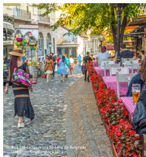
Rua Skadarlija, zona boémia de Belgrado

Ortodoxa Sérvia e importante figura da era medieval dos Balcãs. Iremos visitar o seu grandioso interior, decorado com milhões de mosaicos em milhares de tonalidades. De seguida, embrenhamo-nos na história recente da cidade e dos Balcãs, com destaque para o cruzamento entre as ruas Miloseva e Nemanjinaos, onde estão dois edifícios do Ministério da Defesa, parcialmente destruídos durante os bombardeamentos da NATO a 7 de maio de 1999 e que as autoridades recusam reconstruir. Permanecem intocados no centro de Belgrado como que a gritar que os sérvios também sofreram com a guerra. Continuamos até ao coração da cidade, à emblemática e vibrante Rua Skadarlija. Com um espírito artístico e boémio únicos, ficou famosa pelas suas kafanas (tabernas), gastronomia local e por ser um ponto de encontro da cosmopolita cidade. Jantar nesta contagiante zona da cidade. Alojamento.