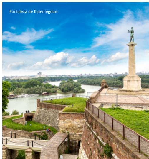
Fortaleza de Kalemegdan

Rumamos até à cidade de Novi Sad. Situada sobre o rio Danúbio, é a segunda maior cidade do país e foi, durante mais de um século, parte integrante da Hungria. Visitamos a cidade e os seus principais monumentos, nomeadamente a Sinagoga, o Teatro Nacional, centro da cultura sérvia durante o regime Austro-Húngaro, a imponente igreja católica neogótica na Praça da Liberdade e os inúmeros edifícios de estilo barroco que envolvem as típicas ruas pedonais. Subimos até à Petrovaradin, uma impressionante fortaleza austríaca do séc. XVIII, onde se encontram muitos estúdios de arte, que abordam desde a escultura à pintura. Lá, apreciaremos a vista panorâmica da cidade, do rio e da montanha Fruška Gora. Regressamos a Belgrado, capital da ex-Jugoslávia. Visita à Igreja Ortodoxa de São Sava, o maior local de culto ortodoxo dos Balcãs e uma das 10 maiores igrejas do Mundo, onde se acredita estar sepultado São Sava, fundador da Igreja