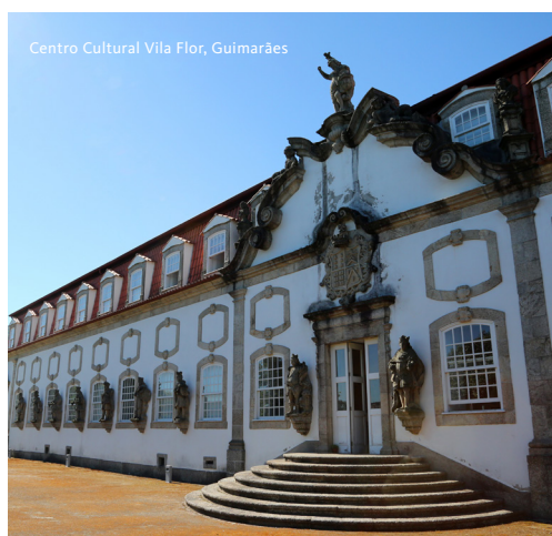
Centro Cultural Vila Flor, Guimarães