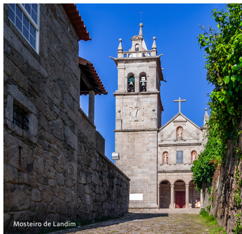
Mosteiro de Landim