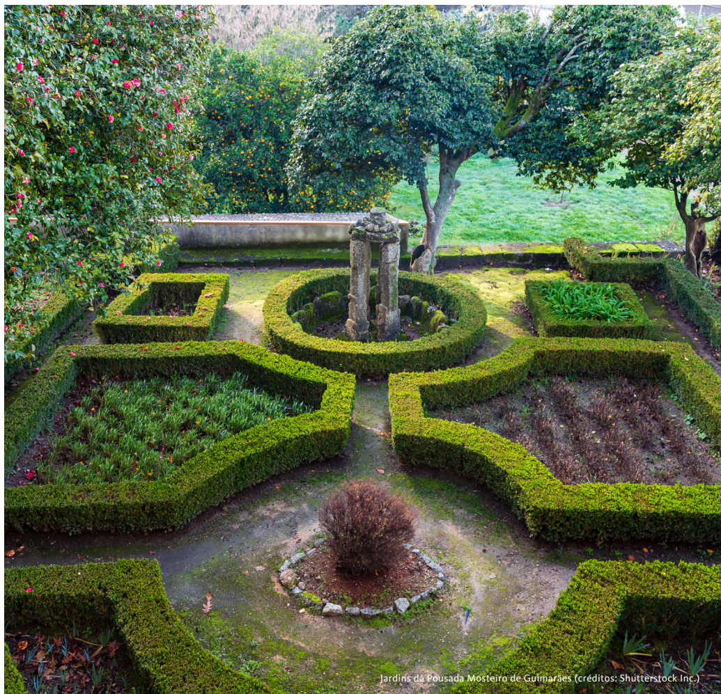
Jardins da Pousada Mosteiro de Guimarães