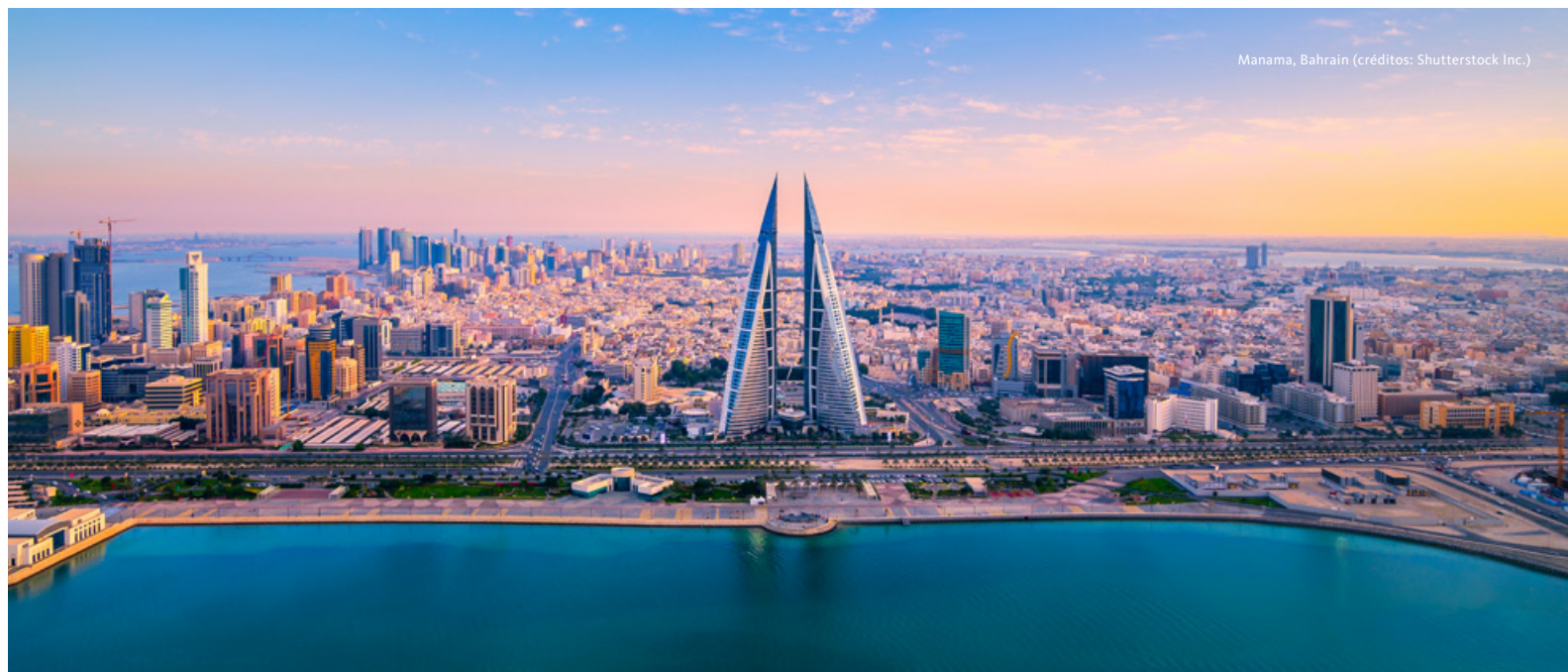
Manama, Bahrain