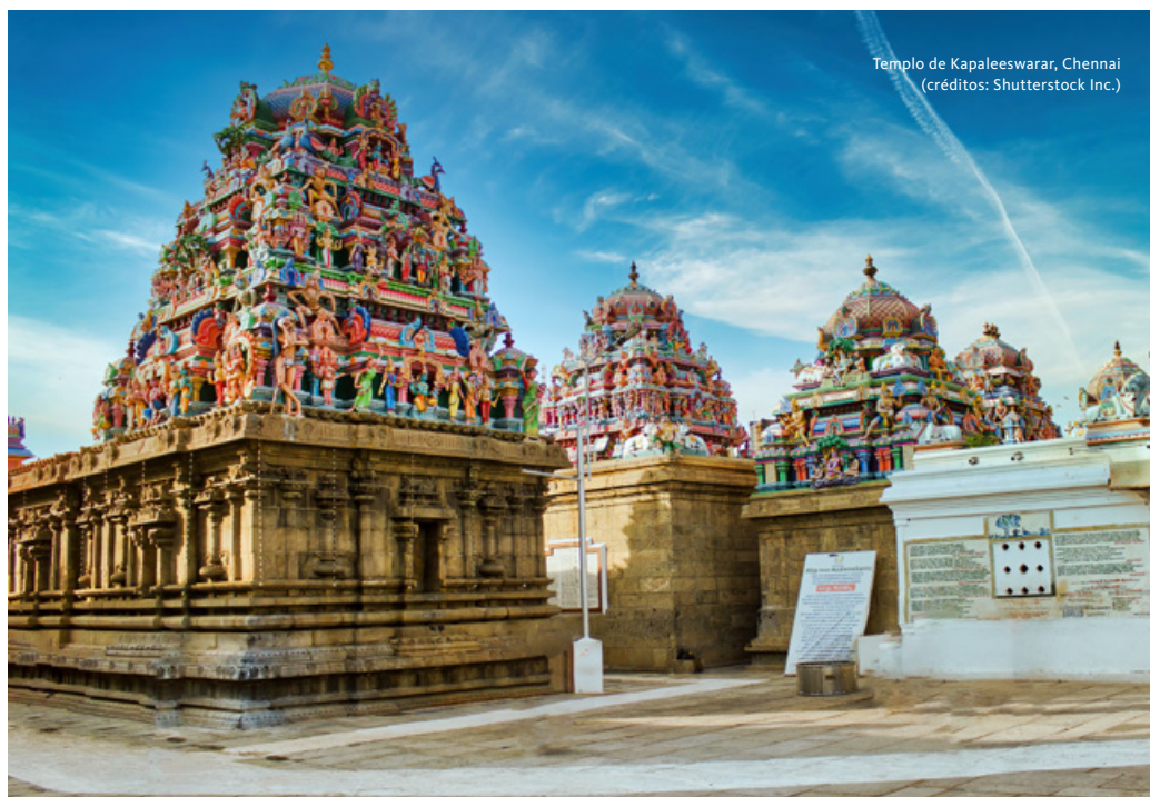
Templo de Kapaleswarar, Chennai

Partida para Alleppey. Embarque num cruzeiro a um mundo de surpreendente tranquilidade, através dos longos canais (backwaters) de Alleppey, com a natureza em todo o seu esplendor. A construção destes barcos é surpreendente, pois todas as placas de madeira são fixadas sem recurso a um único prego. Este meio de transporte veio substituir as antigas