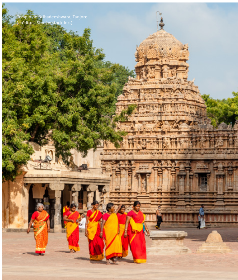
Templo de Brihadeeshwara, Tanjore