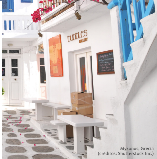
Mykonos, Grécia