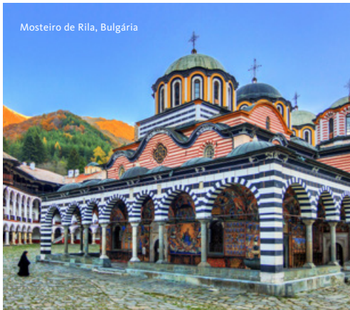
Mosteiro de Rila, Bulgária