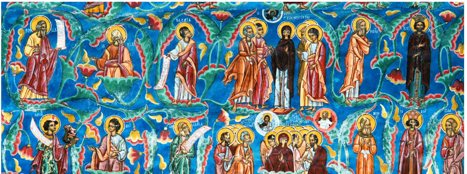
Mosteiro em Moldovita, Romênia

Tempo livre. Transfer ao aeroporto para embarque em voo com destino a Portugal, via uma cidade europeia. Fim da viagem.