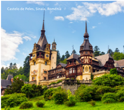
Castelo de Peles, Sinaia, Romênia