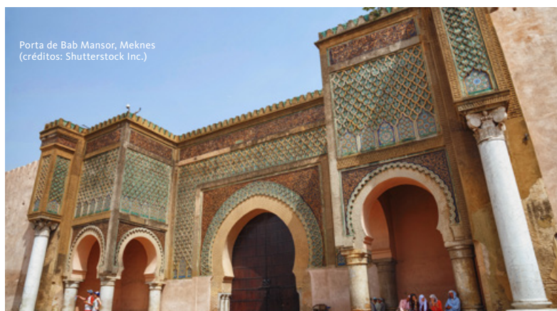
Porta de Bab Mansor, Meknes