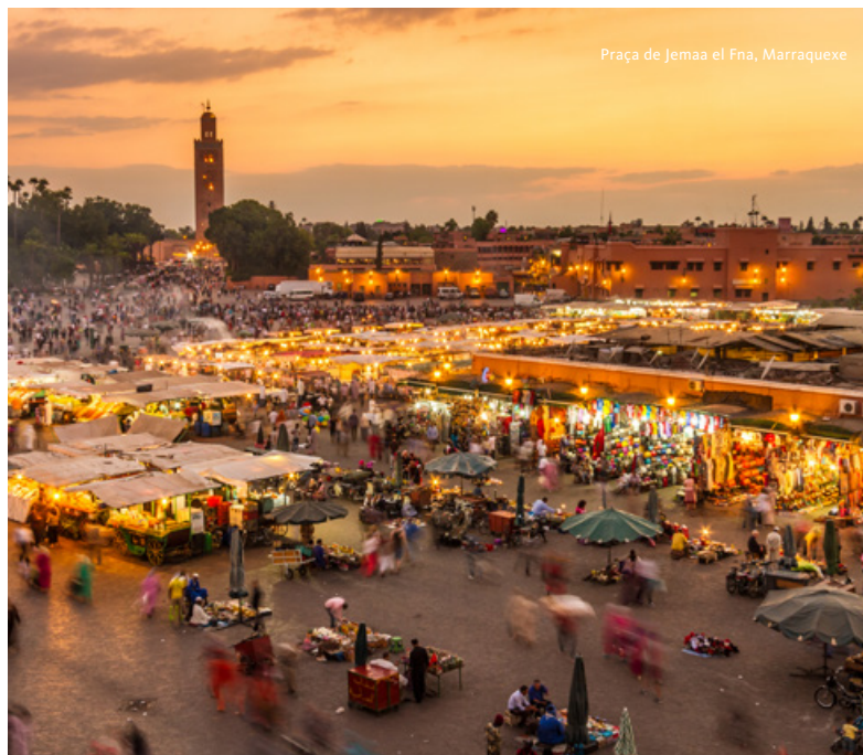
Praça de Jemaa el Fna, Marraquexe