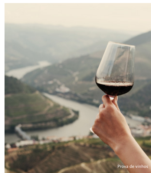
Prova de vinhos