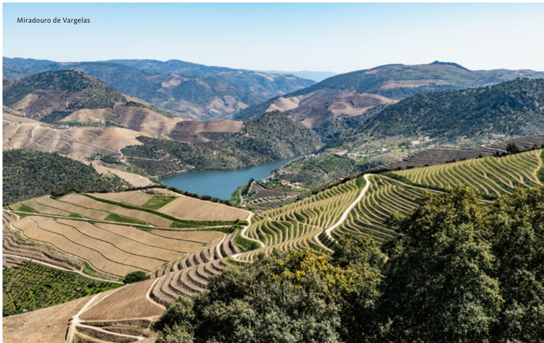
Miradouro de Vargelas

“Quem subir ao alto de Vargelas ficará com a certeza de que chegou ao ponto mais belo do céu.