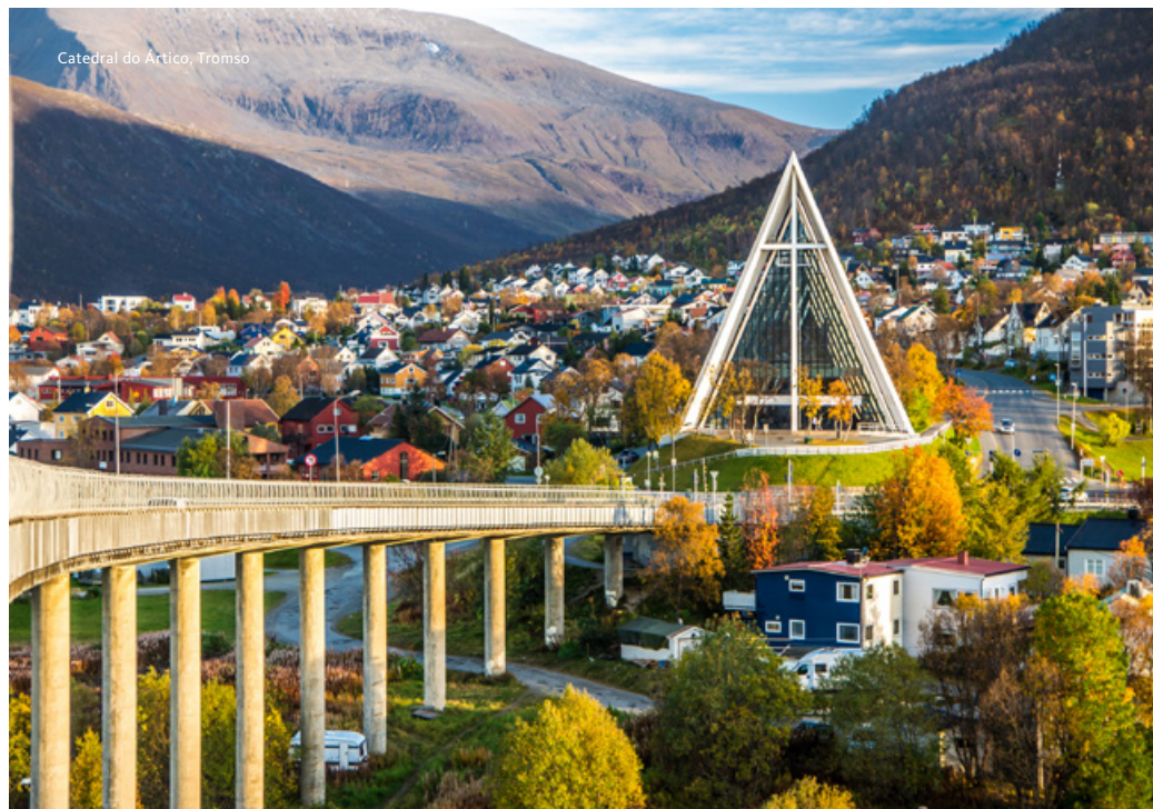
Catedral do Ártico, Tromsø