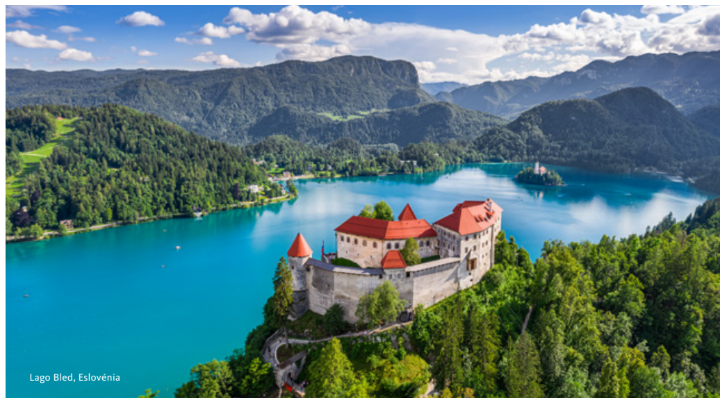
Lago Bled, Eslovénia

Partida para Bled, um dos maiores e mais emblemáticos cartazes turísticos da Eslovénia. Visita ao Lago, no qual as montanhas se refletem, formando um local de beleza paradisíaca. Passagem de pletna, barco tradicional para a sua ilha e passeio, a pé, pelo centro com destaque para o antigo