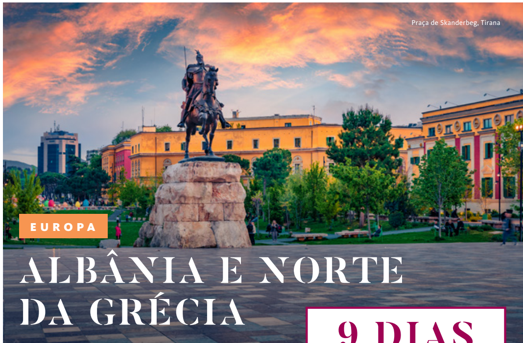
Praça de Skanderbeg, Tirana