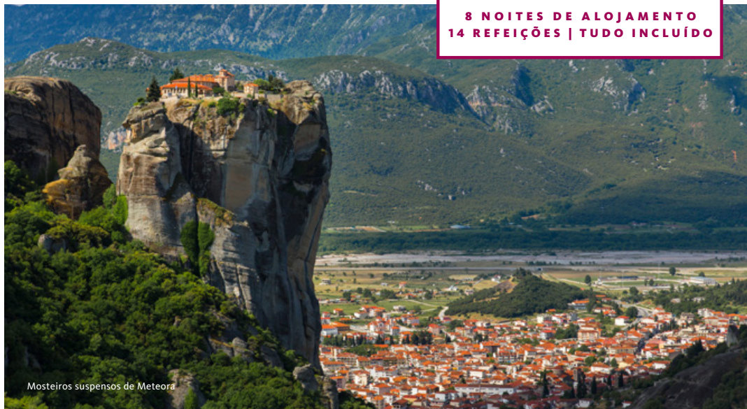
Mosteiros suspensos de Meteora

8 NOITES DE ALOJAMENTO 14 REFEIÇÕES | TUDO INCLUIDO