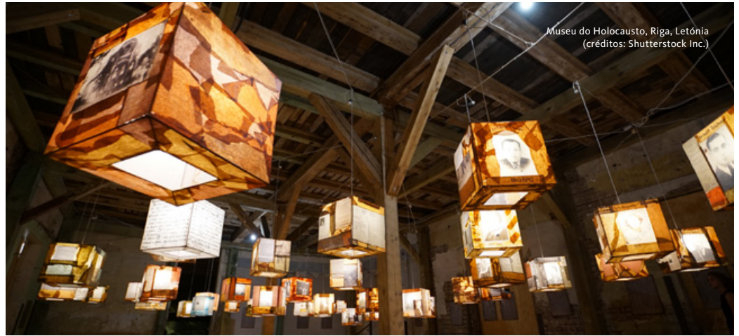
Museu do Holocausto, Riga, Letónia

Saída em direção à floresta de Paneriai para visita ao Museu e Memorial de Paneriai, local de martírio onde foram assassinados os judeus de Vilnius e arredores. O memorial, construído em 1985, inclui 9 monumentos a judeus, polacos, lituanos, prisioneiros de guerra soviéticos e ciganos. Saída para Trakai, antiga capital do Grande Ducado da Lituânia ladeada por três lagos. Destaque para o majestoso castelo medieval, construção do século XIII que hoje alberga o museu histórico da cidade. Almoço. Continuação da viagem para Siauliai, a quarta maior cidade da Lituânia. Visita à Colina das Cruzes, situada nos arredores da cidade de Siauliai, no norte da Lituânia, um lugar impressionante, simultaneamente místico e cativante. Nela amontoam-se centenas de milhares de cruzes, sobrepostas entre si numa aparente desorganização, deixadas ao longo de centenas de anos por peregrinos. Continuação para Riga, capital da