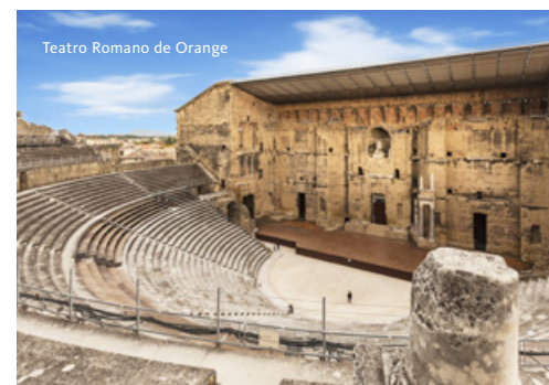
Teatro Romano de Orange