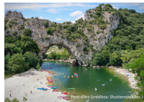
Pont d'Arc