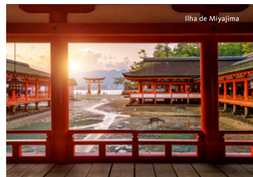
Ilha de Miyajima

Saída para o sopé do Monte Fuji, com uma altura de 3.775 metros, considerado a “Montanha Sagrada” do Japão e fonte de inspiração de poetas e pintores. Visita ao Centro de Interpretação do Monte Fuji. Continuação