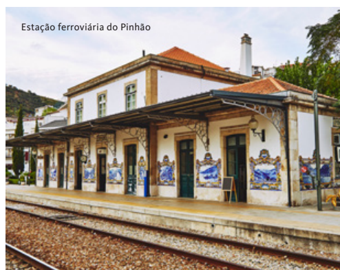
Estação ferroviária do Pinhão