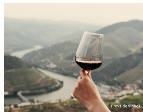
Prova de vinhos