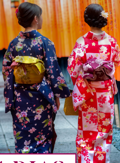
Santuário Fushimi Inari Taisha em Quioto