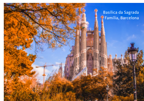
Basílica da Sagrada Família, Barcelona