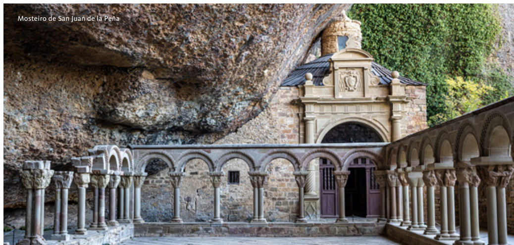
Mosteiro de San Juan de la Peña