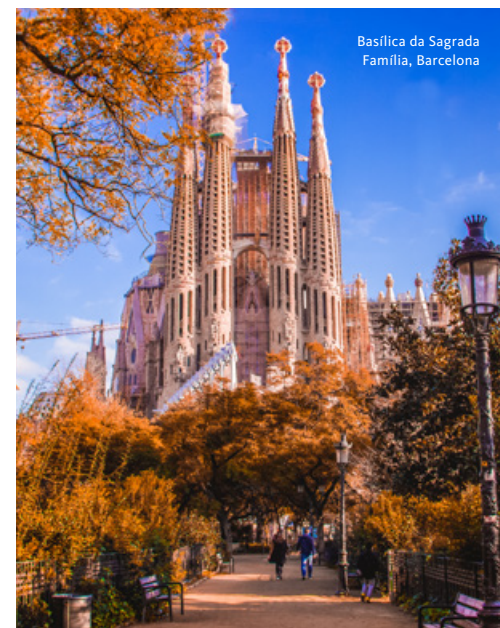
Basílica da Sagrada Família, Barcelona