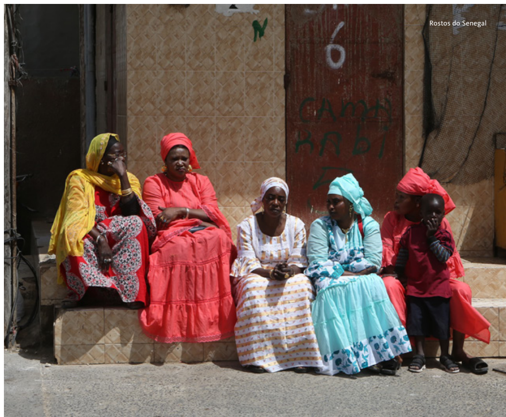
Rostos do Senegal

Partida em direção ao Parque Nacional Djoudj,