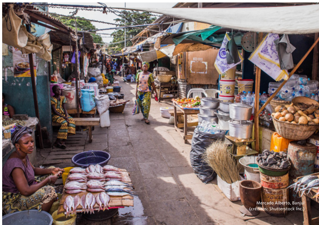
Mercado Alberto, Banjul

Chegada a Lisboa e continuação em transfer privativo para o Porto. Fim da viagem.