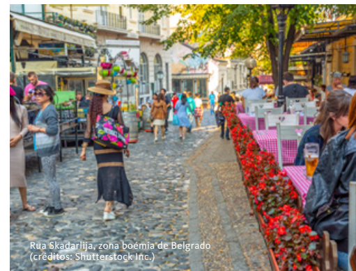
Rua Skadarlija, zona boémia de Belgrado

a visita a esta simpática localidade com uma prova do famoso vinho Bermet. Seguimos para a cidade de Novi Sad. Situada sobre o rio Danúbio, é a segunda maior cidade do país e foi, durante mais de um século, parte integrante da Hungria. Visitamos a cidade e os seus principais monumentos, nomeadamente a Sinagoga, o Teatro Nacional, centro da cultura sérvia durante o regime Austro-Húngaro, a imponente igreja católica neogótica na Praça da Liberdade e os inúmeros edifícios de estilo barroco que envolvem as típicas ruas pedonais. Subimos até à Petrovaradin, uma impressionante fortaleza austríaca do séc. XVIII, onde se encontram muitos estúdios de arte, que abordam desde a escultura à pintura. Lá, apreciaremos a vista panorâmica da cidade, do rio e da montanha Fruška Gora. Regresso a Belgrado. Jantar. Alojamento.