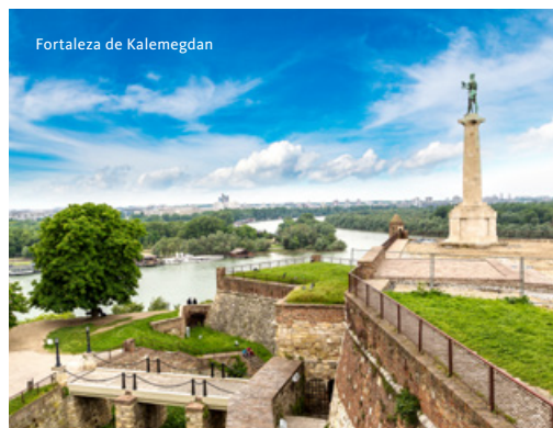
Fortaleza de Kalemegdan

Rumamos até Sremski Karlovci, uma das mais pitorescas cidades, nas margens do rio Danúbio, conhecida por ter sido sede da Igreja Ortodoxa Sérvia durante a monarquia da Casa Real de Habsburgo. Visitamos, a pé, o centro histórico desta elegante cidade de estilo neoclássico com o seu centro religioso da Ortodoxia Sérvia, dando destaque à Catedral Ortodoxa de S. Nicolau, ao mais antigo ginásio da Sérvia (construído em 1791 e atualmente uma escola de gramática), e à fonte Quatro Leões. Terminamos