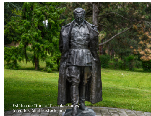
Estátua de Tito na “Casa das Flores”