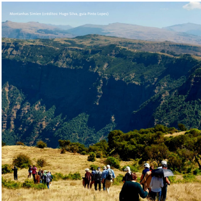
Montanhas Simien