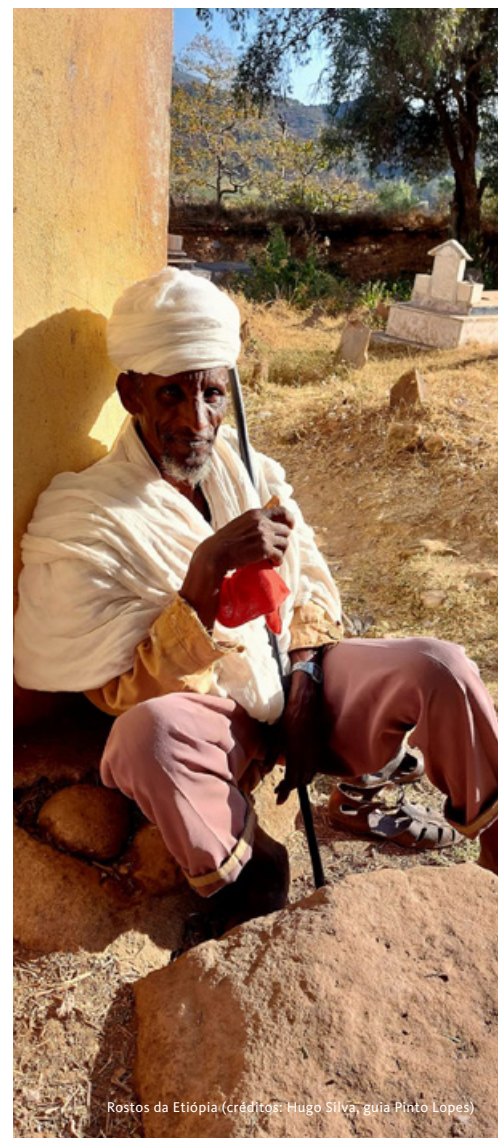
Rostos da Etiópia