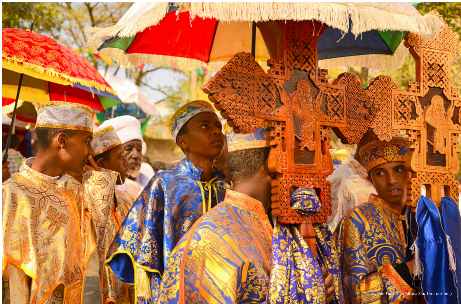
Festival de Timkat