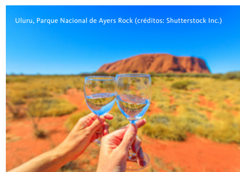
Uluru, Parque Nacional de Ayers Rock

Manhã de excursão de autocarro pelo centro de Sidney, onde teremos a oportunidade de contemplar uma variedade de contrastes - desde a arquitetura tradicional vitoriana da Câmara Municipal e do Edifício Queen Victoria até aos modernos arranha-céus da zona empresarial; do design impressionante da Opera House até aos desenvolvimentos contemporâneos de Darling Harbour. Passagem pelo Jardim Botânico até à Lady Macquarie’s Chair, onde poderemos desfrutar de vistas panorâmicas sobre o porto de Sidney. Continuação até à imponente St. Mary’s Cathedral e visita aos exclusivos subúrbios do Leste, passando por Kings Cross, em direção a Vaucluse e Double Bay. Depois, seguiremos até as Heads para explorar Bondi Beach e visitar a histórica Paddington, com as suas características casas de cidade adornadas com grades de ferro. Regresso ao centro de Sidney. Tempo livre para atividades de carácter pessoal. No final da tarde, prepare-se para uma noite inesquecível ao embarcar no Cruzeiro Especial de Fim de Ano no Darling Harbour. Saída, a pé, até ao cais para embarque do cruzeiro. Durante o cruzeiro, aprecie as vistas espetaculares dos emblemáticos pontos turísticos de Sidney enquanto saboreia um jantar gourmet em estilo buffet, acompanhado por uma seleção de bebidas premium. A festa