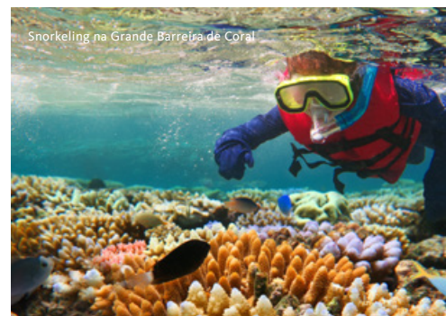
Snorkeling na Grande Barreira de Coral

continua com espetáculo de cabaret e animação de um DJ ao vivo, garantindo a diversão à medida que a meia-noite se aproxima. Quando o novo ano chegar, celebre com todo o estilo e glamour, assistindo ao magnífico espetáculo de fogo de artifício que ilumina o céu e a baía. O regresso ao cais acontece após uma noite cheia de diversão e celebração. Regresso, a pé, ao hotel. Alojamento.