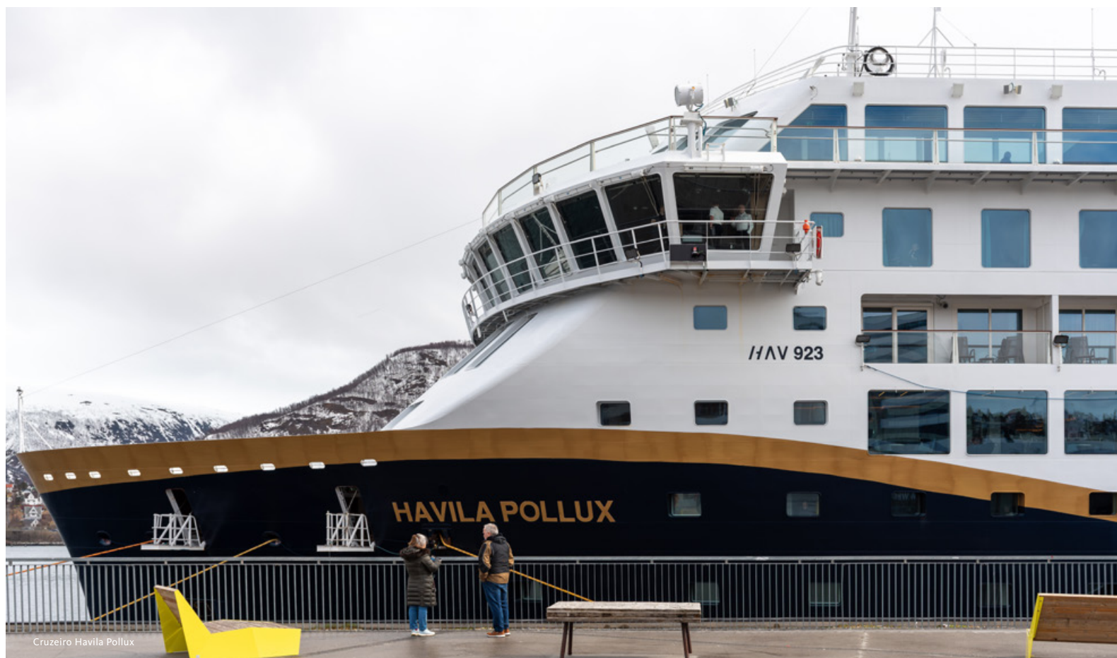
Cruzeiro Havila Pollux