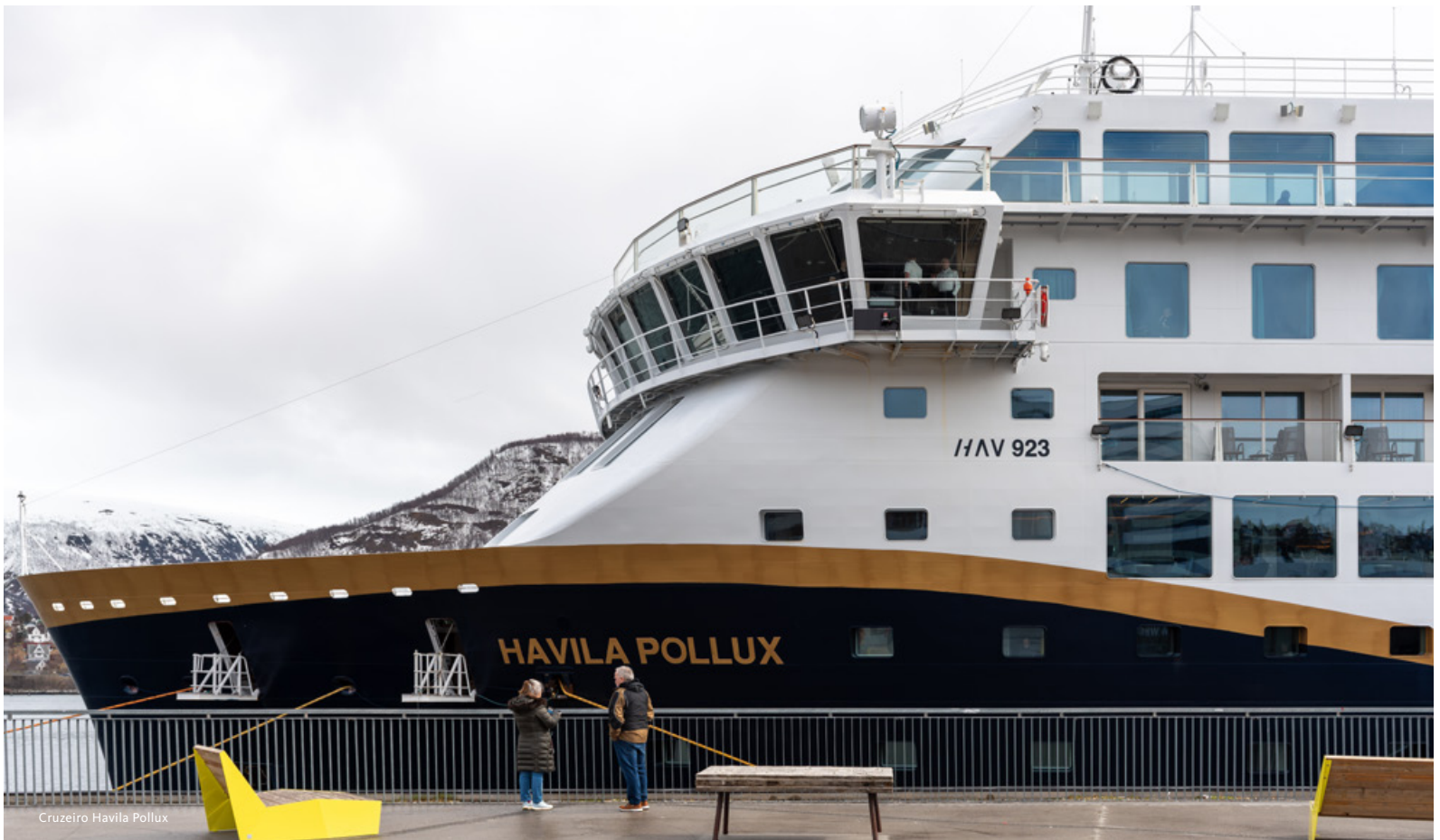
Cruzeiro Havila Pollux