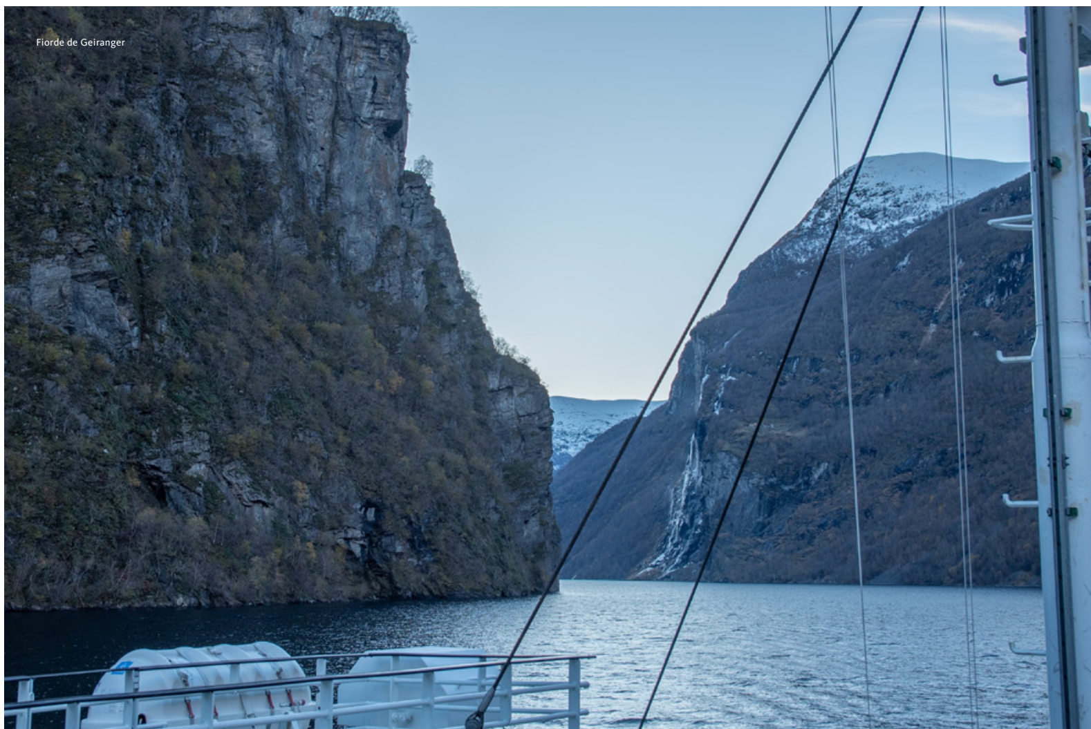
Fiorde de Geiranger