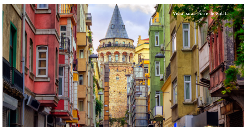
Vista para a Torre de Gálata