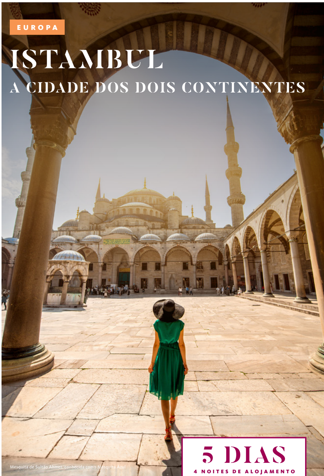
Mesquita de Sultão Ahmet, conhecida como Mesquita Azul