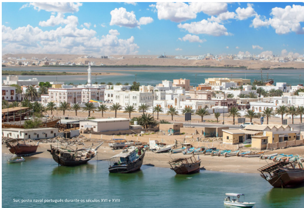
Sur, posto naval português durante os séculos XVI e XVII