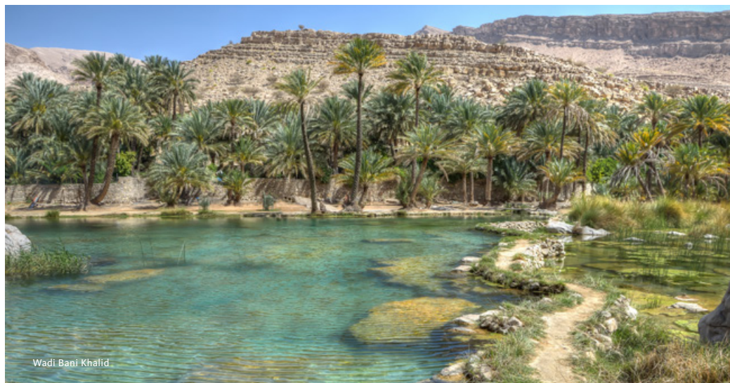
Wadi Bani Khalid

Hoje permaneceremos no coração do sultanato com visita marcada para dois importantes marcos históricos. Começamos por Jabreen, onde apreciaremos, nos tectos da fortaleza local, requintadas pinturas e esculturas com versos do Alcorão, e seguimos depois para forte de Bahla, património da Humanidade. Prosseguimos viagem até à típica aldeia centenária de Al Hamra, o local ideal para apreciar devidamente a arquitectura tradicional