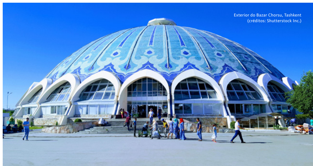
Exterior do Bazar Chorsu, Tashkent

Salvaguardam-se as situações cobertas ao abrigo da nossa apólice de seguro de viagem no capítulo Cancelamento Antecipado.