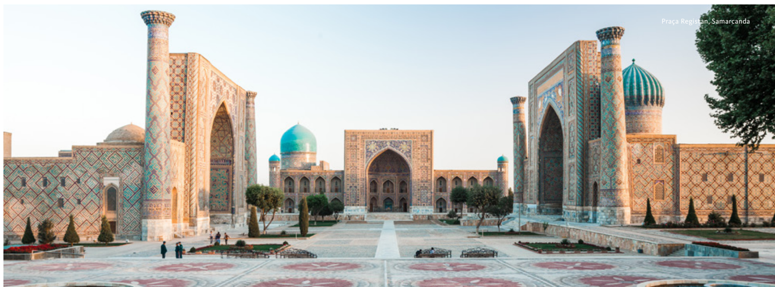
Praça Registan, Samarcanda

Visita ao Palácio Sitorai-Mokhi-Khosa, residência de verão do Emir de Bukhara, construído num estilo que mistura influências russas e orientais dos inícios do século XX.