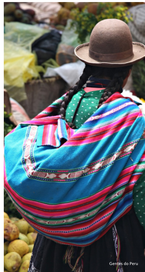
Gentes do Peru

Salvaguardam-se as situações cobertas ao abrigo da nossa apólice de seguro de viagem no capítulo Cancelamento Antecipado.