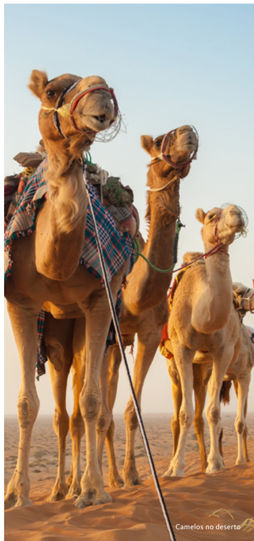
Camelos no deserto