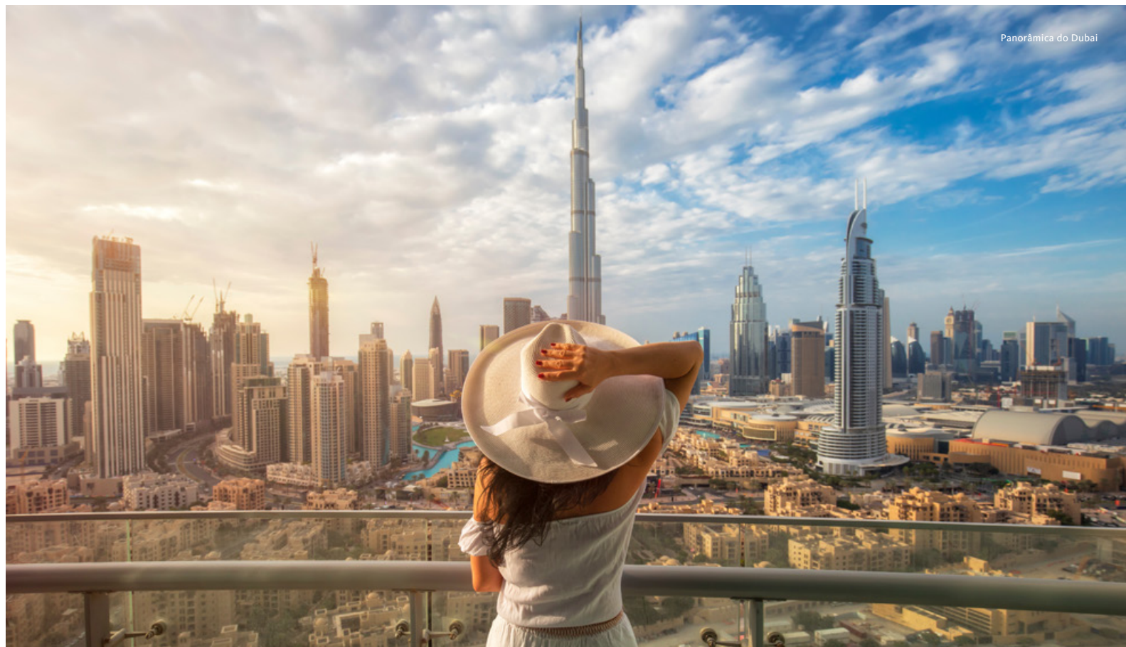
Panorâmica do Dubai

explorar os diversos ambientes tradicionais deste emirado, desde as montanhas até às zonas costeiras, reflexo do seu quotidiano, hábitos e artesanato. Passagem pelo exterior do Forte Al Hisn (Forte de Sharjah) recentemente transformado em museu. Jantar. Alojamento no Sheraton Sharjah Beach Resort & Spa 5* (partida abril) // Center Hotel Sharjah 4* (partida maio e outubro), ou similar.