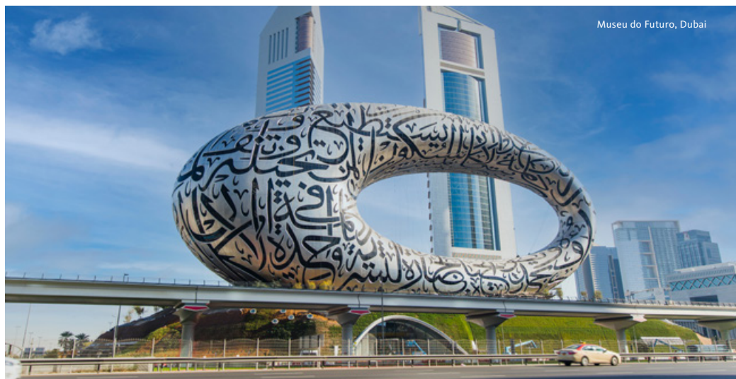
Museu do Futuro, Dubai

Transfer ao aeroporto para embarque em voo com destino a Lisboa. Chegada e continuação em autocarro privativo para o Porto. Fim da viagem.