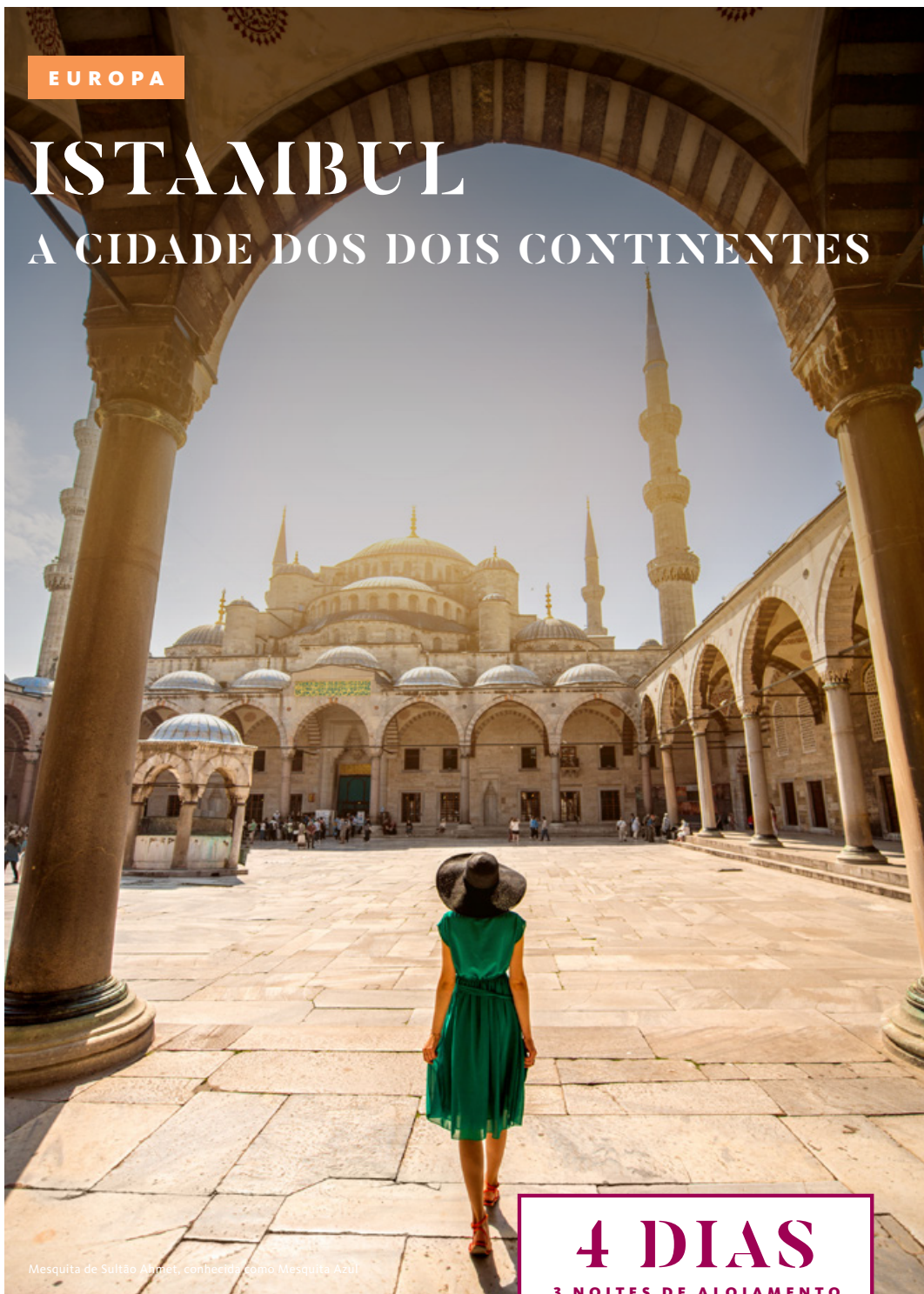
Mesquita de Sultão Ahmet, conhecida como Mesquita Azul

4 DIAS 3 NOITES DE ALOJAMENTO 6 REFEIÇÕES | TUDO INCLuíDO