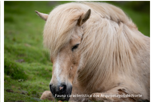
Fauna característica dos Arquipélagos do Norte

CANCELAMENTO: Até 121 dias antes da partida, sem gastos; De 120 a 91 dias antes da partida – 25% do custo total da viagem; De 90 a 61 dias antes da partida – 40% do custo total da viagem; De 60 a 21 dias antes da partida – 75% do custo total da viagem; De 20 a 0 dias antes da partida – 100% do custo total da viagem. Salvaguardam-se as situações cobertas ao abrigo da nossa apólice de seguro de viagem no capítulo Cancelamento Antecipado.