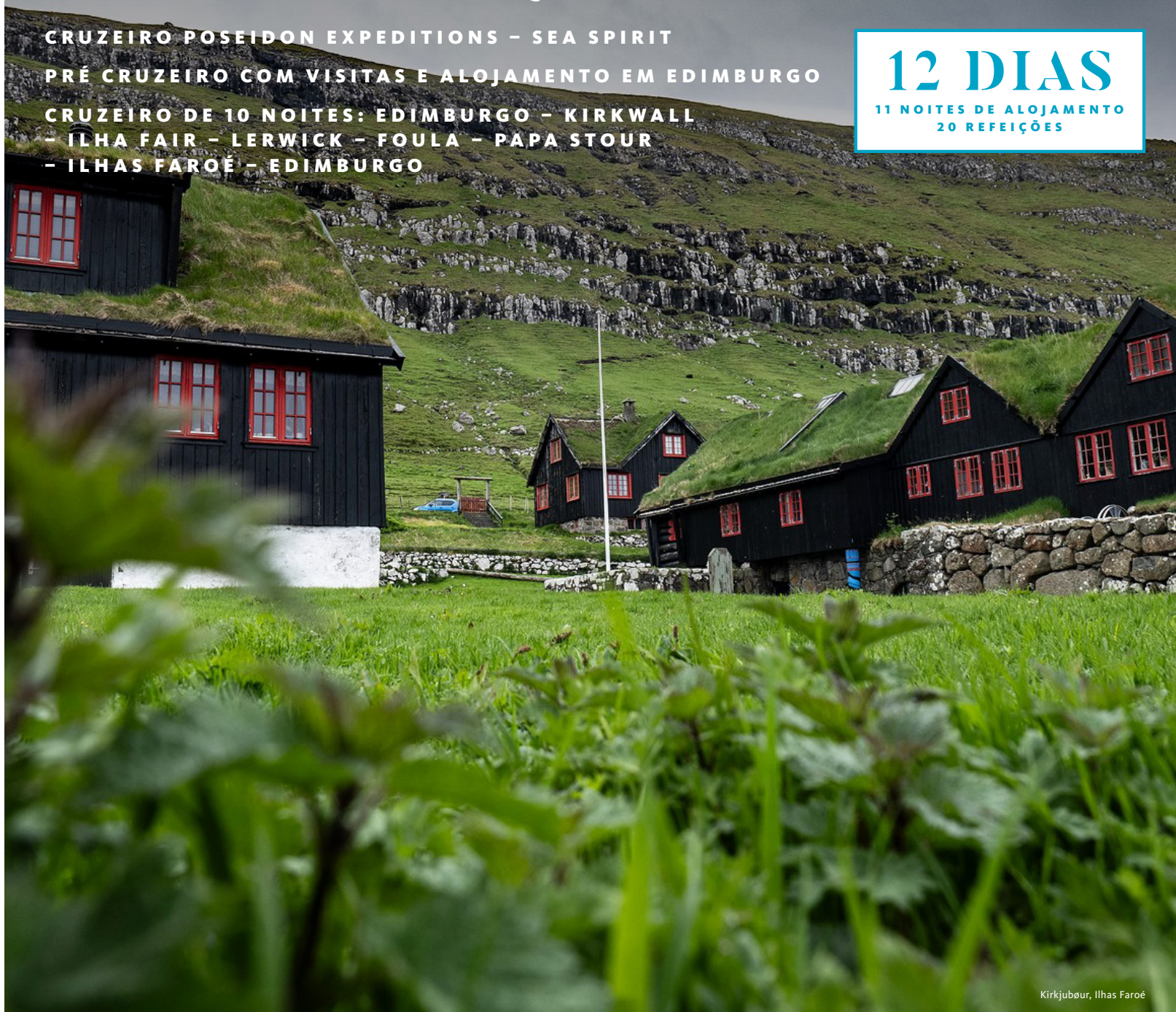
Kirkjubour, Ilhas Faroé