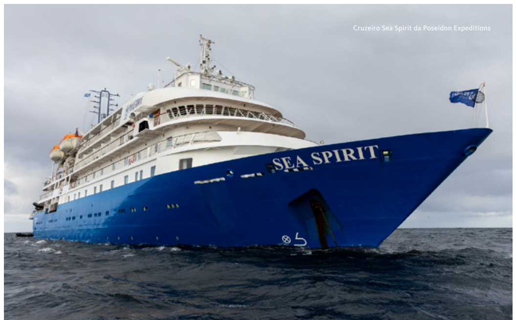
Cruzeiro Sea Spirit da Poseidon Expeditions

NOTAS: O itinerário, os desembarques e todas as outras atividades durante o cruzeiro dependem fortemente das condições meteorológicas e estão sujeitos às decisões do Líder da Expedição e do Capitão da embarcação. Não é possível garantir encontros com qualquer uma das espécies de vida selvagem mencionadas. Preço da viagem sujeito a flutuações cambiais. Programa elaborado a 19 de setembro de 2025.