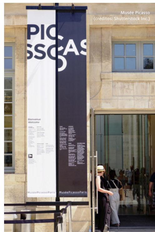
Musée Picasso