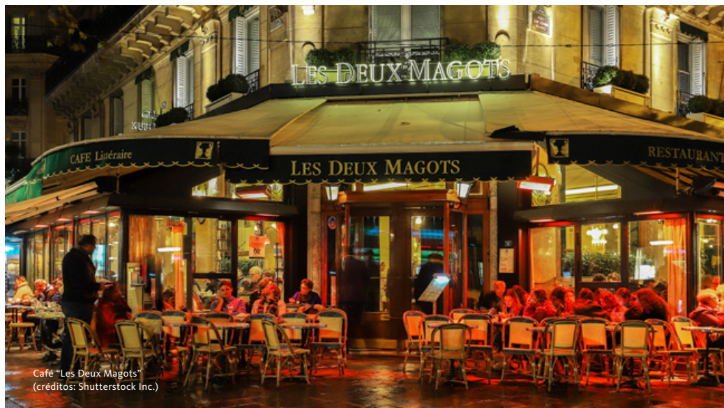
Café "Les Deux Magots"