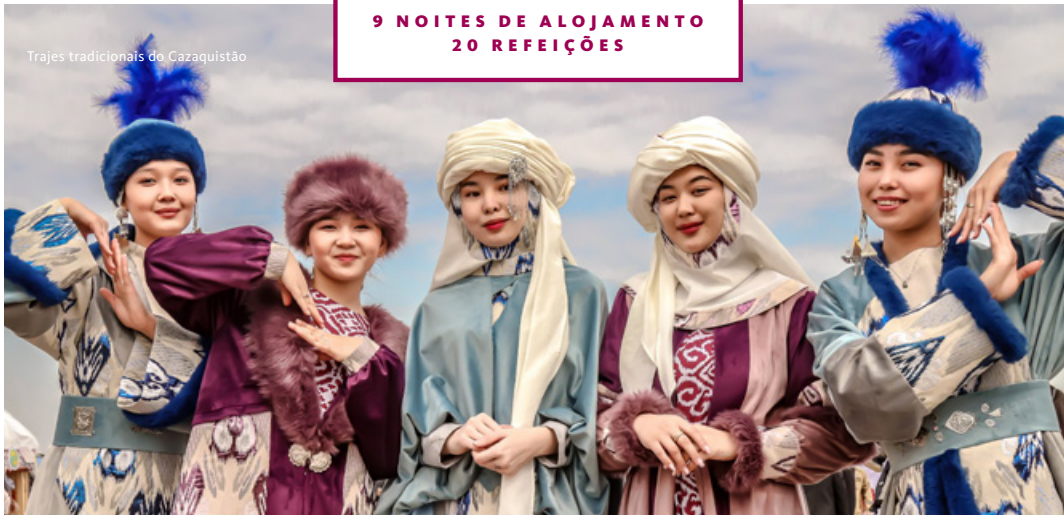
Trajes tradicionais do Cazaquistão

Embarque numa fascinante viagem pela Ásia Central, onde história, cultura e paisagens impressionantes se entrelaçam. Desde Ashgabat, a capital do Turquemenistão, com os seus grandiosos monumentos e mesquitas, explore as ruínas de Nisa e de Kunya Urgench, ambas Património da Humanidade pela UNESCO. Prosseguimos em direção a Moynaq, com visita ao Cemitério dos Navios e ao museu local do Mar de Aral, onde aprenderemos mais sobre a história do mar e a tragédia ecológica que ocorreu. No Cazaquistão, vivencie o contraste entre o vibrante epicentro cultural de Almaty, as maravilhas naturais do desfiladeiro de Medeo e a moderna capital Nur-Sultan, uma cidade onde a arquitetura futurista e a tradição convivem em harmonia. Prepare-se para uma experiência inesquecível, num roteiro que oferece uma perspectiva única sobre uma das regiões mais intrigantes do mundo.