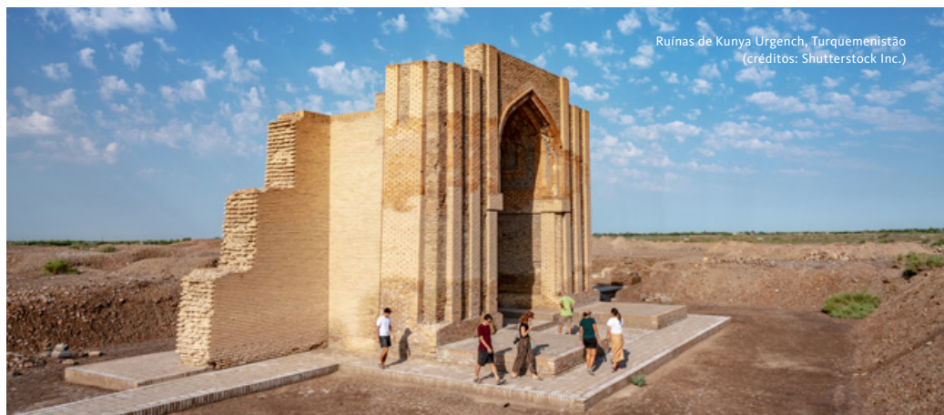
Ruínas de Kunya Urgench, Turquemenistão

Saída em direção a Alzhir, um Campo de Trabalho para as Mulheres dos Traidores da Pátria. Localizado a cerca de 35 km de Astana, é atualmente um Museu das Vítimas da Repressão de Akmol. Regresso a Nur-Sultan. Almoço. Visita ao Museu Militar, instituição