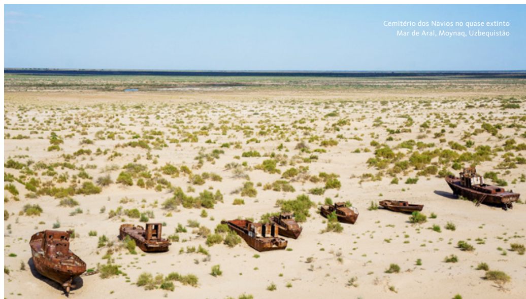
Cemitério dos Navios no quase extinto Mar de Aral, Moynaq, Uzbequistão

Em horário a combinar localmente, transfer ao aeroporto para embarque em voo com destino a Almaty, antiga capital do Cazaquistão, considerada atualmente o epicentro cultural e comercial do país. Almoço. Início das visitas a Almaty, com destaque para o Museu Estatal Central, um dos maiores da Ásia Central,