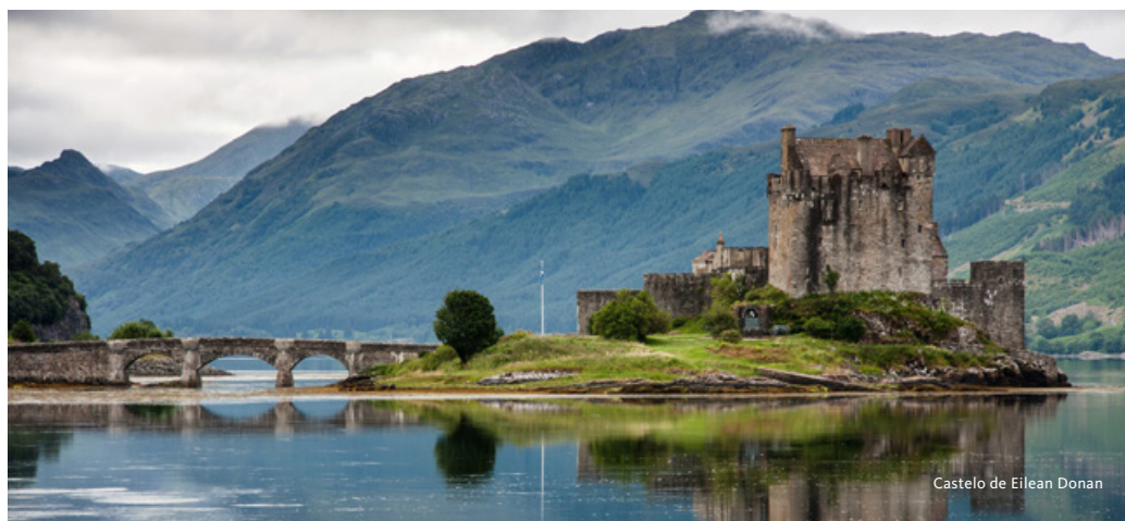
Castelo de Eilean Donan

Partida para St. Andrews, importante cidade universitária e capital mundial do golfe. Panorâmica com destaque para o primeiro campo de golfe da História. Visita às ruínas da Catedral de St. Andrews e da Torre de St. Rule. Continuação para Perth, local de grande simbolismo por acolher a mítica Pedra do Destino, um dos artefactos mais importantes da história escocesa, utilizado nas coroações dos reis britânicos. Esta cidade histórica, também conhecida como “Cidade Justa”, está localizada nas margens do Rio Tay e foi capital da Escócia, assim como um dos seus principais burgos reais. Destaque para o recém-inaugurado Museu de Perth, que abriga atualmente a Pedra do Destino. Após a vitória de Eduardo I sobre a Escócia, em 1296, esta foi levada para Londres, onde permaneceu por quase 700 anos. Em 1996, foi finalmente devolvida à Escócia, continuando a ser um símbolo poderoso da sua identidade e herança cultural. Jantar. Alojamento no Hotel River Ness (partida 8 agosto) // Hotel Courtyard by Marriott Inverness Airport (partida 24