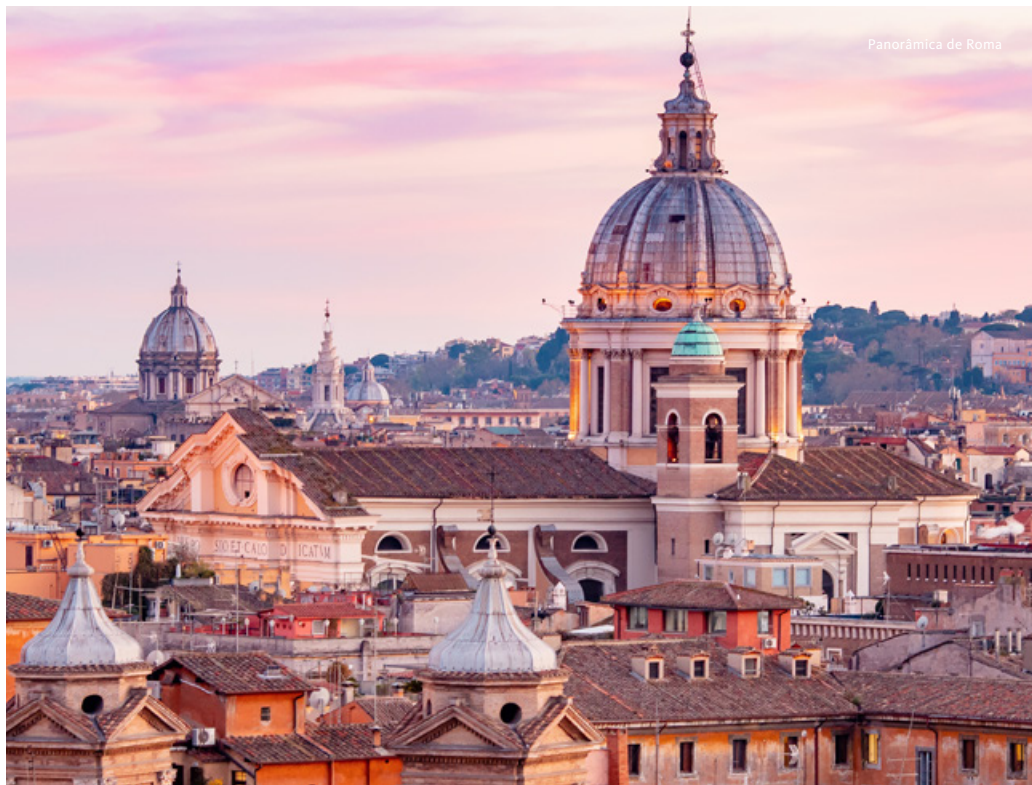
Panorâmica de Roma

Início das visitas, a pé, ao Coliseu (aquisição dos bilhetes sujeita às normas e disponibilidade dos monumentos)***, cuja construção, no ano 72 d.C., se ficou a dever ao Imperador Vespasiano, que tinha como objetivo oferecer aos habitantes a possibilidade de assistir a combates mortais entre gladiadores e lutas de animais selvagens, entre outros espetáculos. Continuação pela avenida dos Fóruns Imperiais e passagem pelo Monumento Nacional a Vítor Emanuel II, também conhecido por Altar da Pátria. À tarde, passeio pela Praça Navona, onde se encontra a Fontana dei Quattro Fumi.