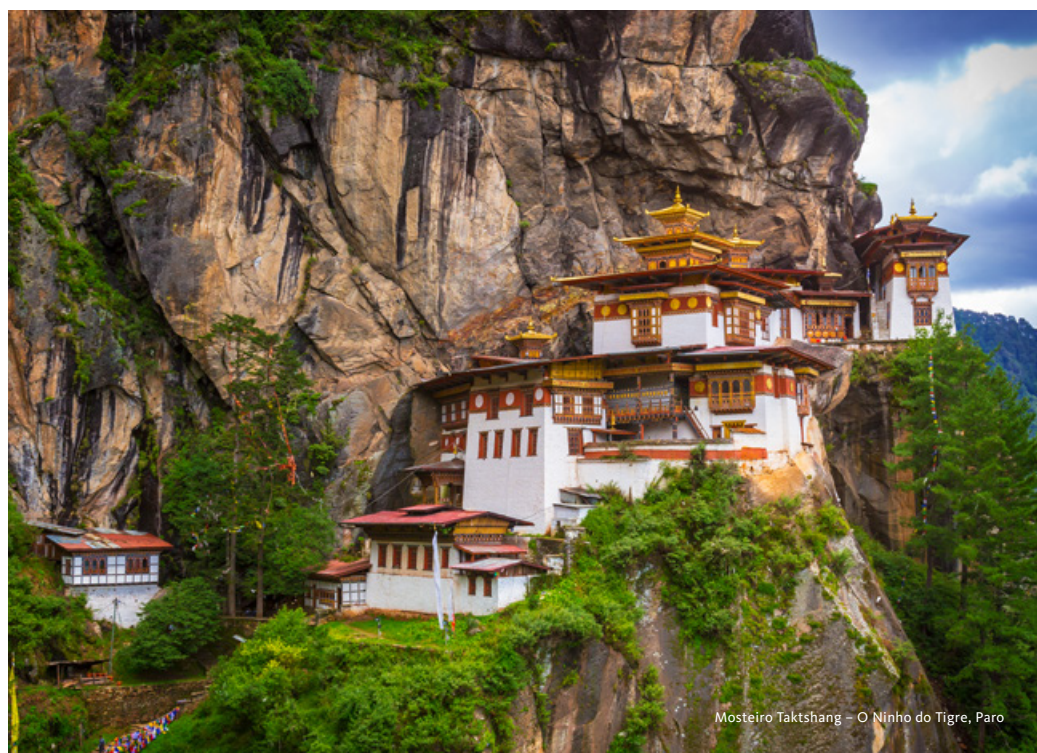
Mosteiro Taktshang – O Ninho do Tigre, Paro

Saída para Changu Narayan. Visita ao Templo construído no século IV e classificado Património da Humanidade pela UNESCO. Este templo é dedicado ao Lord Vishnu na sua encarnação como Narayan, o ídolo com 10 cabeças e 10 braços. Possui um telhado duplo com leões em pedra a guardar as portas. Partida para a cidade de Bhaktapur (Património da Humanidade pela UNESCO), em pleno Vale de Kathmandu. Visita à cidade, também conhecida como a Cidade da Cultura, e famosa pela arte e cultura tradicionais. Por muitos considerada um museu a céu aberto, reúne belíssimas e inúmeras obras-primas de carácter monumental. Destaque para a praça principal da cidade, praça Durbar e para o palácio das 55 janelas mandado construir pelo rei Bhupatindra Malla e residência da realeza até 1769. Visita ao Templo Taleju, dedicado à deusa Taleju Bhawani. Este santuário, como outros no Vale de Kathmandu, é um local sagrado que inclui templos dedicados à deusa Taleju Bhawani e à deusa viva, Kumari. Almoço. Partida para Patan, a cidade das artes e da arquitetura. Fundada em 250 d.C., é a segunda cidade mais importante