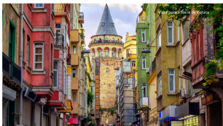
Vista para a Torre de Gálata