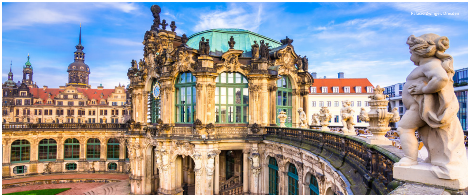
Palácio Zwinger, Dresden