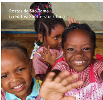
Rostos de São Tomé