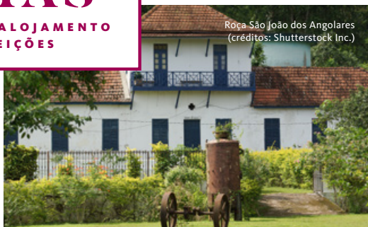
Rocha São João dos Angolares

Deixe-se envolver pela magia de São Tomé e Príncipe, onde a natureza exuberante, as praias paradisíacas, o passado colonial e a tradição do cacau e do café se entrelaçam para oferecer uma experiência inesquecível. Explore a ilha de São Tomé, com as suas roças históricas e cascatas secretas, aventure-se em trilhos off-road, e navegue em águas cristalinas até ao Ilhéu das Rolas, para pisar a linha do Equador. Esta viagem é uma celebração dos sentidos, repleta de momentos de descoberta e imersão num dos destinos mais acolhedores e autênticos de África.