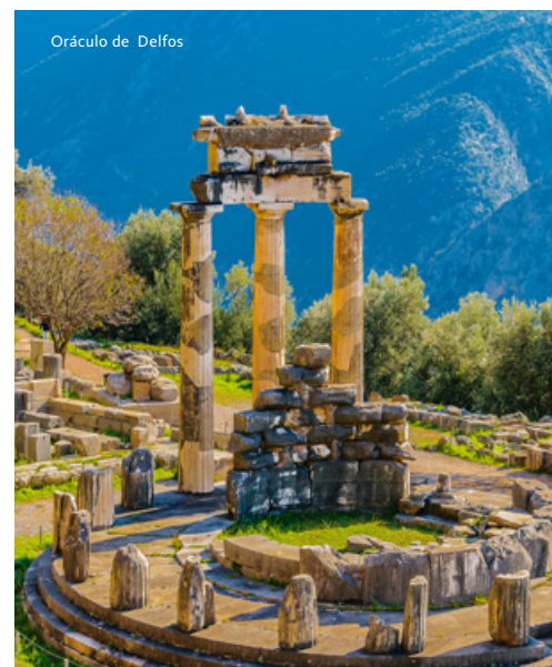
Oráculo de Delfos

Visita à Acrópole e ao seu novo Museu, uma importante obra de arquitetura contemporânea, construído em aço, vidro e cimento, com 14.000 metros 2 , onde se exhibe uma ampla coleção de peças pertencentes à Acrópole. Almoço entre as visitas. Transfer ao aeroporto para embarque em voo com destino a Lisboa. Chegada e continuação em transporte privativo para o Porto. Fim da viagem.