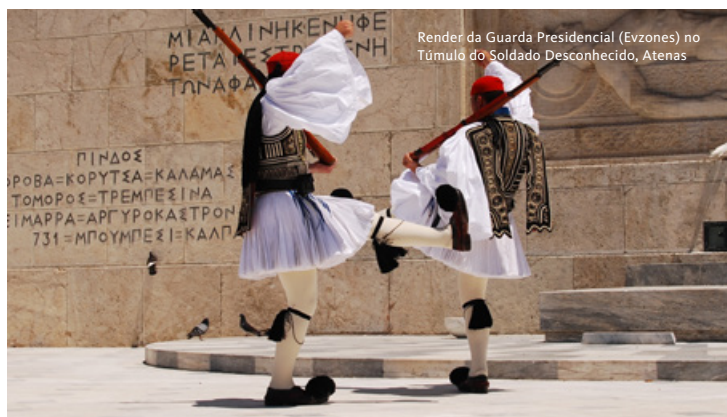
Render da Guarda Presidencial (Evzones) no Túmulo do Soldado Desconhecido, Atenas